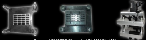
Περφορέ BLISTER Μηχανής UHLMANN - IMA