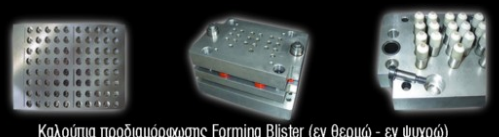
Καλούπια προδιαμόρφωσης Forming Blister (εν θερμώ - εν ψυχρώ)