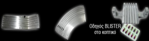
Οδηγός BLISTER στο κοπτικό

40 Χρόνια προσφοράς & γνώσης Εγγύηση στην ποιότητα & την εξυπηρέτησή σας