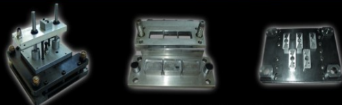
Κοπτικά BLISTER Μηχ. UHLMANN - MARCHESINI - IMA (1 - 5 θέσεων)